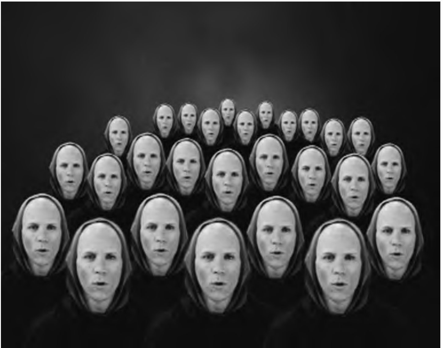
Björn Melhus, The Oral Thing, 8 min, loop auf DVD, 2001

ÖKUMENISCHE BEITRÄGE ZU ERZIEHUNG UND UNTERRICHT