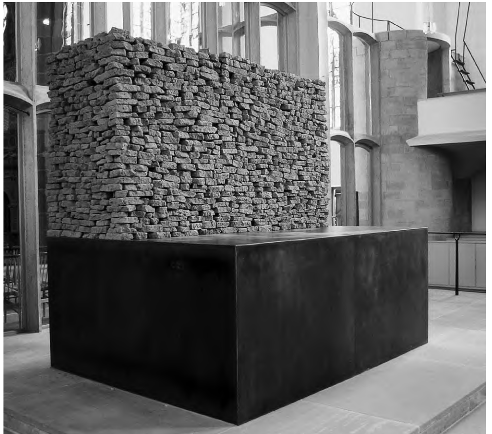
Madeleine Dietz, Altarumbau, 1997 Kassel Kirche St. Martin

in einem »fruchtbaren Konflikt« mit der Lebendigkeit der Erde. Durch die künstlerische Neuinszenierung des Altarbereichs wird das bisherige rituelle Zentrum verändert und in seinen formalen Gegebenheiten bewusst gemacht. Kreuz und Altar werden dabei nur scheinbar den Blicken entzogen, denn durch das Verbergen des bisher Gewohnten wird die Frage nach dessen Gestalt und Gehalt virulent. Gleichzeitig wird der Ort nun durch das Kunstwerk von Madeleine Dietz neu definiert. Er bekommt eine Gestaltqualität, die religiöse Betrachter an die Altäre Jahwes im Jerusalemer Tempel erinnern könnte, wie sie etwa der Psalm 84 vor Augen führt.